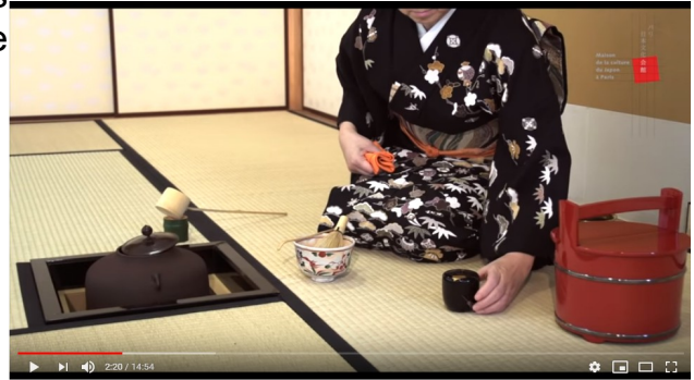
Cérémonie du thé - MCJP

La cérémonie du thé est toujours considérée comme un véritable art de vivre dans la culture japonaise.