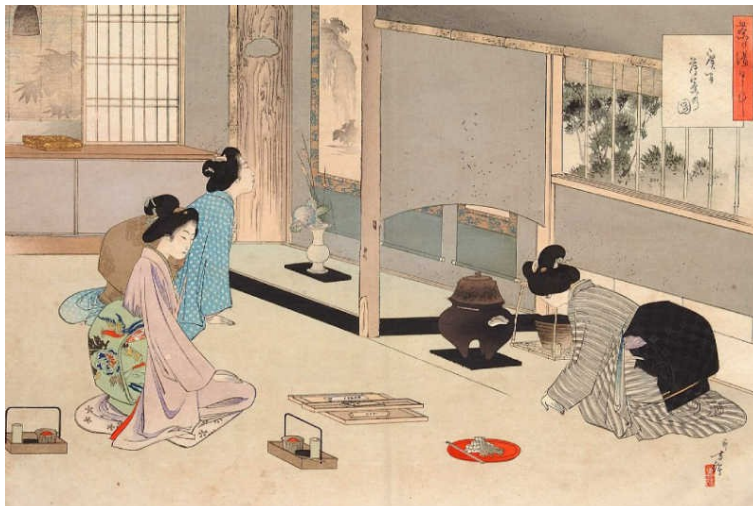
Les origines de la cérémonie du thé

La cérémonie du thé est originaire de Chine : Gong Fu Cha (« Le temps de prendre le thé »). Importée par les moines bouddhistes zen au IX ème siècle, le Sadō (« la voie du thé ») est devenu au fur et à mesure un rituel codifié.