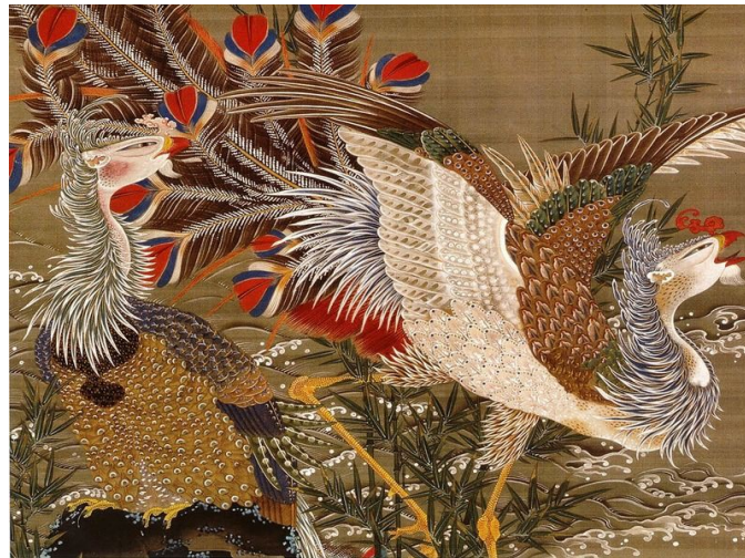
Le Royaume coloré des êtres vivants

Itō Jakuchu est un peintre japonais né à Kyōto (1716 -1800) qui s'inscrit dans l'ère Edo (1603 - 1867). Le peintre est surnommé « l'homme à la main divine » à cause des couleurs vives qu'il utilise. Il est spécialisé dans la peinture d'animaux et de fleurs.